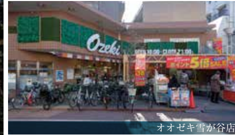
オオゼキ雪が谷店