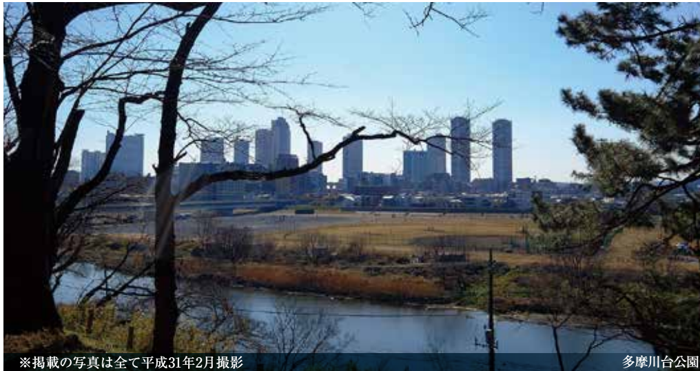
※掲載の写真は全て平成31年2月撮影