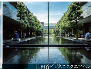
世田谷ビジネススクエアヒルズ