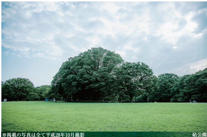
※掲載の写真は全て平成28年10月撮影